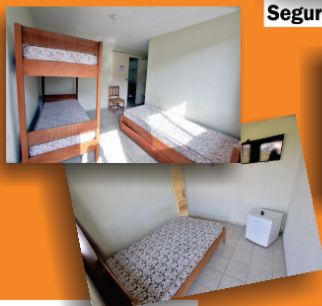
Apartamentos com TV e frigobar