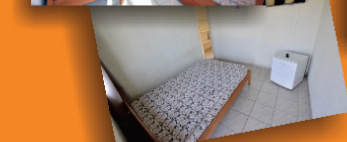
Apartamentos com TV e frigobar